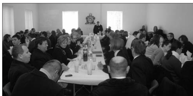
A lelkészértekezlet résztvevői a hanvai Diakóniai Központban

nisztérium osztályvezetője emelkedett szólásra. Elmondta, a jelenlegi kormányzat a Kárpát-medencét egy egységként kezeli, igyekszik segíteni az egyes részek közötti kapcsolattartást, támogatja a határon túli magyar oktatást, hozzá kíván járulni ahhoz, hogy a szórványban élő magyarság hitélete, magyar identitása, kultúrája megmaradjon.