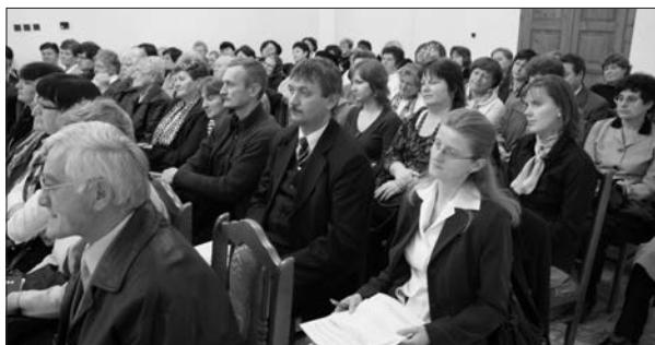
A nagyidai konferencia résztvevői

tak teherbe esni. Az eredmény az lett, hogy kétszeres volt a megtermékenyülés azoknál, akikért imádkoztak, mint akikért nem. G. Tóth Anita szólt arról is, hogy azoknak a férfiaknak, akiknek jó kapcsolatuk van a feleségükkel és gyerekeikkel, háromszor nagyobb esélyük van arra, hogy tovább éljenek, ritkábban betegszenek meg, mint akiknek ez nem adatik meg.