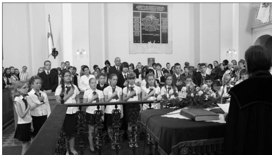
A rimaszombati elsősök fogadalomtétele.