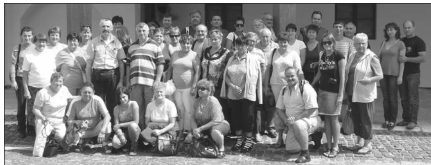
A vendégsereg a lőcsei kiránduláson