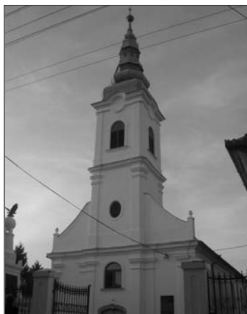
A szépen felújított zsigárdi templom

A vasárnapi istentiszteleten kívül más alkalom nincs a gyülekezetben. A presbitérium tagjai azonban havonta egyszer összejönnek, amikor a lelki táplálék mellett terítékre kerül a gyülekezet gondja-