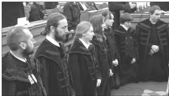
Kézráttétel előtt.