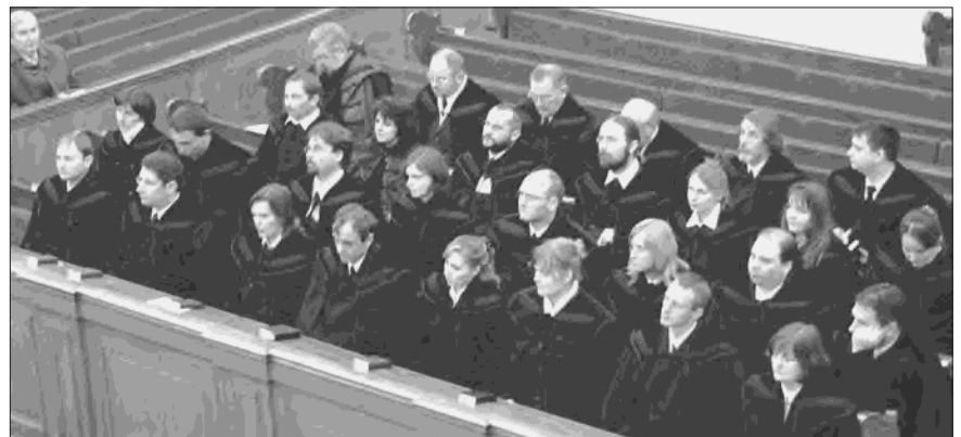
A felszentelendő lelkipásztorok a prédikációra figyelnek (háttérben az esperesek)

Salamon bölcs és értelmes szívet kért Istentől, amikor apja, Dávid örökébe lépett. Teljes őszinteséggel elmondta Istennek, hogy nagy a nép, amely reá lett bízva, s nagy a feladat is, amit ő nem tud ilyen egyszerűen elhordozni. Milyen a bölcs és értelmes szív? Istenre figyelő, neki engedelmes. Az ilyen szív tud igazán különbséget tenni a jó és a rossz kö-