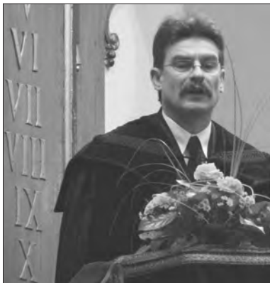
Az igehirdető.

De vajon elegendő-e csupán ez? Hiszen Pál apostol a szeretet himnuszában is azt mondja, hogy: „És ha jövődöt tudok is mondani, és minden titkot és minden tudományt ismerek is..., szeretet pedig nincsen énbennem, semmi vagyok” (1Kor 13,2). Mert mindez önmagában véve csak zengő érc és pengő cimbalom.