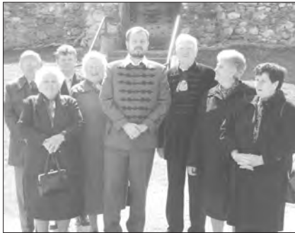
Az evangelizátor és a helybeliek

Bár az evangelizációs esték Berzétén lettek megrendezve, de (amint ez itt már hagyomány, hisz 2002-től évente kétszer vannak evangelizációs alkalmak a környék más-más gyülekezetében) a környékbeli kollégák is besegítettek a szervezésbe. Az érdeklődőket busz hozta és vitte, Pelsőctől Rozsnyóig minden faluba kitérőt téve. Sokan távolabbi gyülekezetekből is kíváncsiak voltak, reméljük,