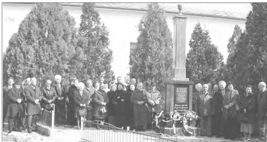
A gellér-bogyai társégyszékházközség tagjai március 18-án az istentisztelet után nemzeti ünnepünk alkalmából megkoszorúzták azt az emlékoszlopot, amit az elmúlt év novemberében állítottak a templom mellett.