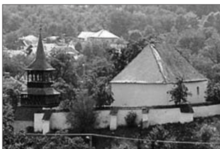
A felsővályi templom