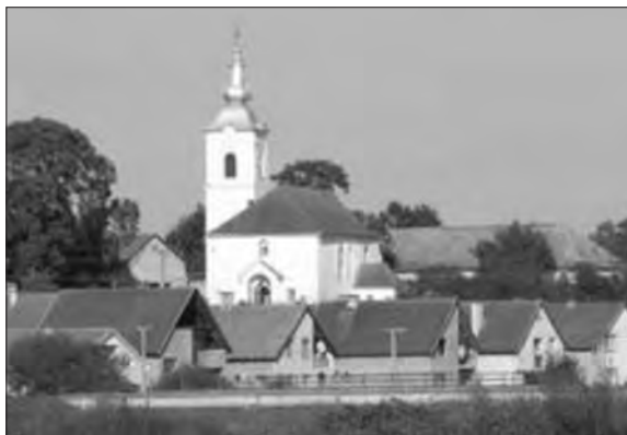
A rimaszécsi református templom

hogy életutunk drága állomásain, alkalmain az énekszó és dal átfórmáljon, örvendezőkke tegyen, hogy hasonlóan elődeinkhez, a régen éltekhez, mi is