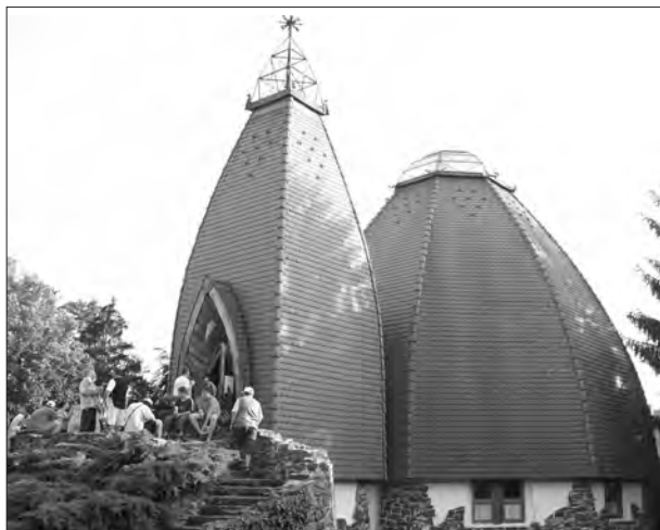
A kőszegi református templom.

A mozgalmas hétre – amellet, hogy a résztvevők megismerkedtek a város nevezetességeivel, múzeumaival, részesei lehettek az idén másodszer megrendezett Kőszegi Ostromnapoknak, minden este a Csete György által tervezett templomban