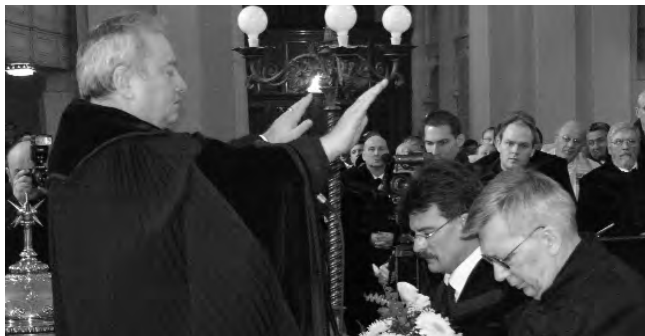
Csúry István királyhágómelléki megbízott püspök megáldja egyházunk új elnökeit.

ségekbe, nem engedhetnek az esetleges hatalmi nyomásnak. Rámutatott arra is, hogy olyan korban élünk, amikor a nagy közösségek sem lehetnek biztonságban, éppen ezért nagyobb hittel és meggyőződéssel, frissességgel és elevenséggel kell Istent hirdetni, mégpedig ott, ahova a küldetésünk állított: a szülőföldön. Utódját figyelmeztette, hogy az Úrra figyeljen, szüntelen neki engedelmeskedjen: dolgát – lélektől lélekig – bátran, hittel tegye, mivel: „A félelem megbénít, a hit azonban előrelendít.” Az igehirdetést követően kivette az esküt az egyház új elnökeiktől, majd kézrátétellel megáldotta őket. Csatlakoztak hozzá egyházkerületünk esperesei, a Kárpát-medencei református egyházak jelenlevő püspökei, illetve a magyarországi és a szlovákiai evangélikus püspökök is, akik szintén kézrátétellel kértek áldást a püspök és a főgondnok szolgálatára.