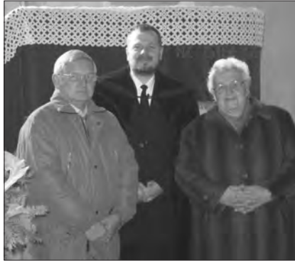
A jubilánsok és a lelkipásztor

A köszöntés a gyülekezet színe előtt történt, meghittsége pedig emelte, hogy jubilánsaink gyermekei, unokái (sőt Isten kegyelméből már egy dédunoka is) a templom padsoraiban ültek. Gyülekeze-