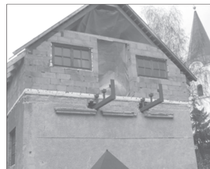
A 2008. év végi állapot

Azonban hiba lenne ölbé tett kézzel várni. Nekünk is mindent meg kell tennünk, ezért szeretném kérni mindazokat, akiket Isten indít, hogy – akár imádsággal, akár kétkezi munkával, akár anyagi segítséggel – álljanak árvaházunk ügye mellé. Hadd érezzük, hogy