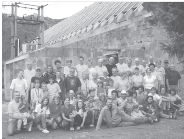
Frízöldi testvéreink csapata

Aztán megindult a falak építése, helyreállítása. Holland testvéreink (közel ötvenen) jöttek, hogy a legzordabb esők és szélfúvások idején szolgáljanak az Úrnak, építsék a házat. Frízföldről érkeztek, ahol ők is kisebbségben élnek