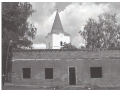
Még tető nélkül az egykori iskola épülete