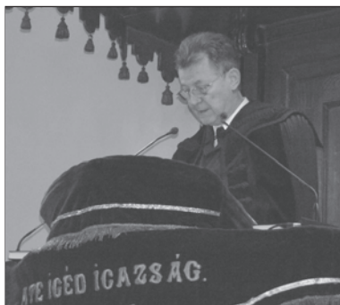
Az igehirdető, Erdélyi Géza püspök

módon, megfélemlítve, erőszakot alkalmazva támad. Azt viszont már legalább felismertük, hogy a kevésbé kézzelfogható erők és hatalmak ellen, a sötétség világának urai, a gonoszság lelkei ellen, amelyek „mennyei magasságban”, azaz fölöttünk vannak és erejük meghaladja a mi erőnket, nagyon nehéz sikeres küzdelmet vívni. Az apostol beszéde „a sötétség világának urai és a gonoszság lelkei el-