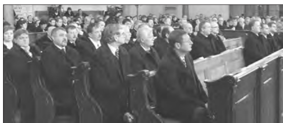
Néhányan a Zsinat tagjai közül