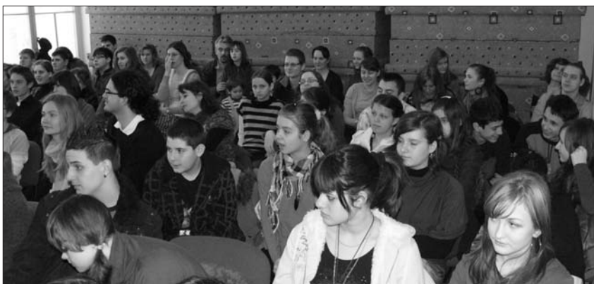
A Nagysallón február 27-én megrendezett ifjúsági találkozón mintegy hetvenen voltak

Boldogan írhatom le: bizonyára kedves volt az Úr előtt, hogy a kilencvenes évek elején megtérésem és az utána következő életem időszaka a Firesz működéséhez fűződik. Kamaszként megélhettem, hogy milyen előkészületek zajlottak egy-egy tábor előtt, hogy pl. egy régi parókia és annak udvara milyen áldott színhellyé vált az Úr Lelke és a vezetők hite által. Hálás vagyok azokért az emberekért, akik abban