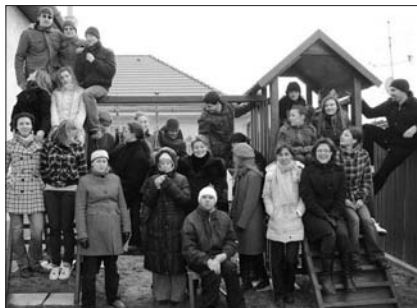
A Jókán március 12-én és 13-án megtartott munkatársi és imaszolgálatos hétvége résztvevői

belül is lehet törődni. Igen, a gyülekezetben nemcsak hogy lehet, hanem kell is foglalkozni a fiatalokkal. A Firesz szolgálata nem helyettesítheti az egyes gyülekezetekben folytatott ifjúsági munkát, a fi-