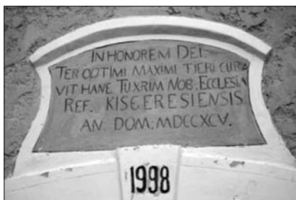
A templomajtó feletti latin felirat tanúsága szerint a tornyot – Isten dicsőségére – 1795-ben építették

el a templomba, ami százhusz–százharminc személyt jelent. Délutánonként már kevesebben vannak, de akkor is eljönnek körülbelül ötvenen. Vannak, akik mind a két alkalmon ott vannak. Amikor az istentiszteletre hívogató harang megkondul,