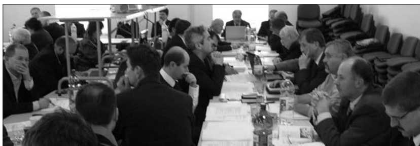
A zsinati képviselők tárgyalás közben.

A Zsinat napirendjén szerepelt egy törvénytervezet, mégpedig az egyes egyházi szertartások végzéséről szóló törvény vitája is. A számtalan érzékeny pontot tartalmazó tervezet vitáját hosszas tárgyalás után a Zsinat végül felfüggesztette. A Közalapról szóló 1/2009-es számú törvény két