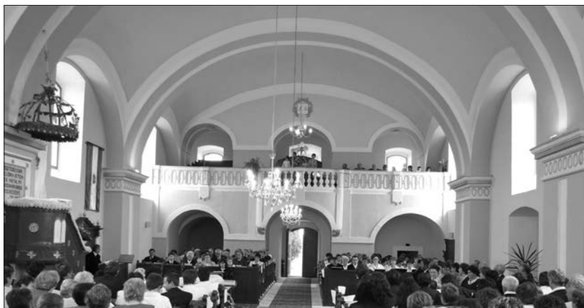
A templom belseje a felújítás után (a felvétel a kórustalálkozó alkalmával készült)

A templom külseje azonban még alapos felújításra vár – mondja a jövőbeli terve-