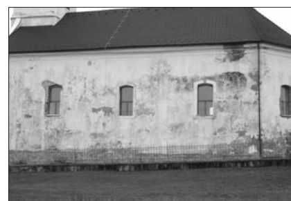
A felújításra váró templomkülső

ket a lelképásztor. A gyülekezet anyagi kereteit viszont alaposan kimerítették a korábbi munkálatok, a jelenlegi helyzetben ennek a kis lélekszámú gyülekezetnek már a parókia fenntartása is egyre na-