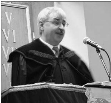
Az igehirdető a rimaszombati református templom szószékén

Ide megy Ámósz, és itt hirdeti az Úr igéjét: Isten ítélete érvényes, és nincs hova menekülnie az embernek. A próféta azt hirdeti, hogy az Úrtól való elfordulás miatt büntetés vár Izráelre. Rájuk dönti még a bételi templomukat is, és nincs hova menekülniük. Ha a holtak hazájába menekülnének, onnan is kiragadja őket, ha az