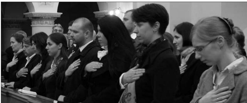
A diakónusok ünnepélyes eskütétele.

Mi, ma élő keresztyének is gyakran elfeledkezünk erről. Úgy élünk, mintha az ítélet a mi életünkre nem lenne érvényes. Pedig a Szentírás azt mondja, hogy meg kell hallanunk a ránk vonatkozó isteni igazságot.