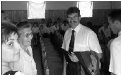
Az ünnepséget megtisztelte jelenlétével Fazekas László püspök is (középen).

szolgálat rugalmasságot, belső állóképességet, szakmai ismereteket, szeretetet és természetesen hitet kíván. Hálások vagyunk Istennek minden külső segítségért, bátorításért, szakmai tanácsért, útmutatá-