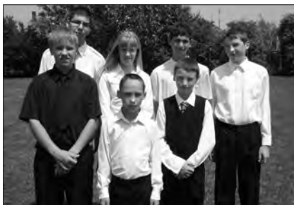
A Jó Pásztor Háza néhány kis lakója

Az otthon alapítóit ez a jézusi gondolat inspirálta: „Aki az ilyen kisgyermekek közül egyet is befogad az én nevéért, az engem fogad be; és aki engem befogad, az nem engem fogad be, hanem azt, aki engem elküldött” (Mk 9,37). Nagyon is forradalmi, újszerű Jézus Krisztusnak ez a megfogalmazása, mert amikor ezt kijelentette, szerte a civilizált világban az apátlan és anyátlan gyermekekkel, a fo-