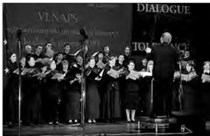
Az egyesített református kórus

A koncert a debreceni Kántusból és a nagyváradi Partiumi Keresztény Egyetem