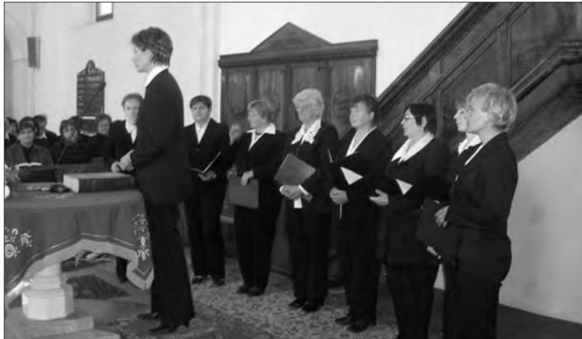
A körös-rudnai kórus

Egy-egy ilyen kórustalálkozó kitűnő alkalom a találkozásra, beszélgetésre,