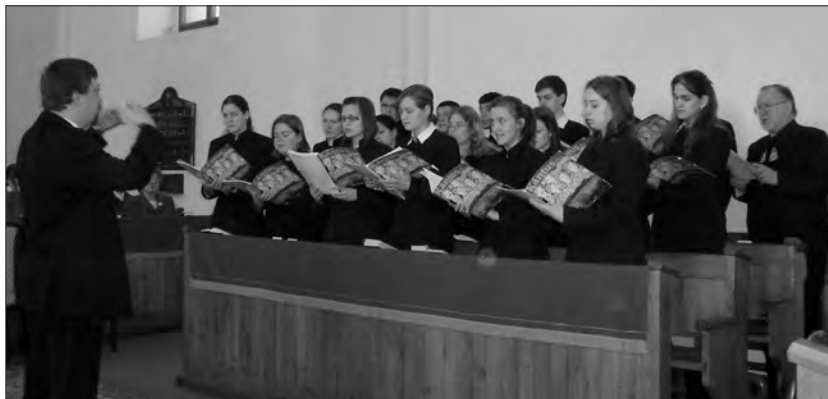
A debreceni Kántus

nagyságos fejedelem, II. Rákóczi Ferenc földi maradványainak megkoszorúzását a Szent Erzsébet-székesegyház