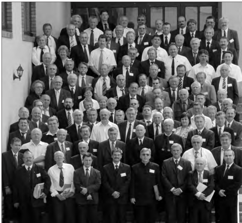
A Generális Konvent komáromi ülésének résztvevői.

Tanulni kell azt, hogy mit jelent egymás felé fordulva azt tenni, amit Krisztus-követésnek lehet nevezni. Először magunkban és magunk között kell rendet tenni és így világítani. Az ige is azt mondja, hogy foglalatossak voltak az