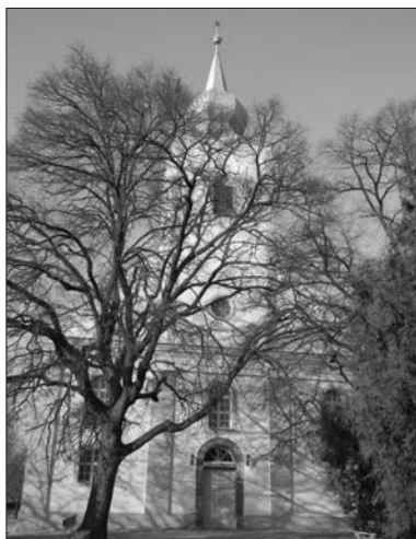
A dunamocsi református templom