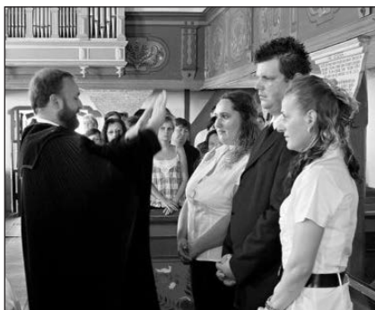
A szalóci konfirmandusok megáldása

ként – valósággal a gyülekezet lelkeként – szeretettel, odafigyeléssel és törődéssel szolgált. A köszöntés utáni szeretetvendégségen jó volt elbeszélgetni életéről, be-