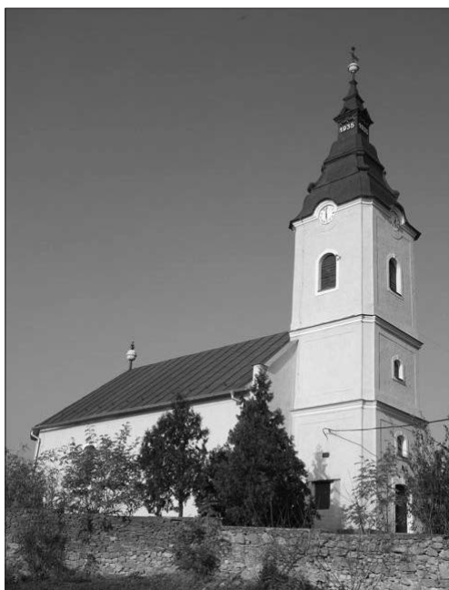
Az örösi református templom

lálkozzanak akár kötetlenebb formában is. Így indították el a teaházat, amelyre havonta egy alkalommal kerül sor a vasárnap délutáni istentisztelet után. Később ezeket az együttléteket egybekötötték keresztény könyvek eladásával, a gyülekezeti könyvtárból való kölcsönzéssel. (A meglévő könyvállományt pályázatok útján igyekeznek gyarapítani és frissíteni.)