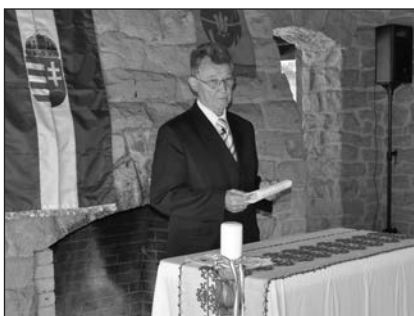
Egyházunk nyugalmazott püspöke két előadást is tartott a találkozón

Magyarországnak háromnegyed százada nincs nemzetstratégiája. A tömegeket internacionalistává, kozmopolitává gyűrték át, miközben a többi szocialista ország kemény és következetes nemzeti politikát folytatott. A kommunista vezetők közül egyedül Kádár János volt internacionalista. Bár a többi is ezt állította önmagáról, de ők valójában következetes nacionalisták voltak, és amennyire csak lehetett, ennek megfelelően cselekedtek. Hogy ennek a bizonyos utódállambeli nemzetpolitikának mi volt a lényege? Egy átfogó, mindenre kiterjedő kisebbségellenesség érvényesítése. A gyermekek születése és névadása pillanatától, az iskoláztatáson és a munkahelyeken keresztül a temetésekig kidolgozott, mérhetetlenül elfogult magatartás. Álljon itt néhány példa: A szülők számos magyar nevet nem adhattak gyermekeiknek. Alig épültek új, korszerű óvodák és iskolák a magyarok lakta településeken. Átgondolt, ügyesen álcázott merényletek elkövetése – ma is folyamatban van – anyanyelvünk ellen.