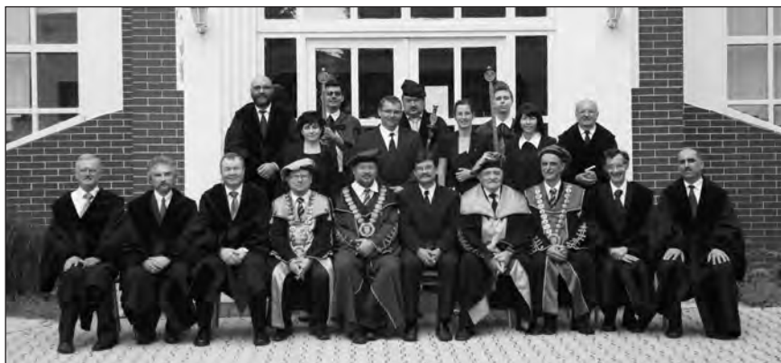
Absolventi teológie s profesormi fakulty, vedením univerzity i cirkvi