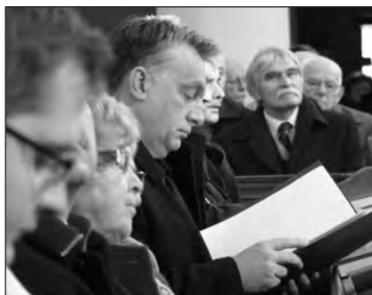
Orbán Viktor miniszterelnök a beszédére készül.

Reméljük, sikerült. Orbán Viktor gondosan előkészített, a reformátusság szá-