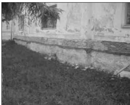
A rimajánosi parókia kívülről és belülről

De az eltelt időszak alatt a parókián már fontos változtatások történtek: nedvesség ellen szigetelték a falakat, szakaszonként kibontották az épület falait, majd másfél méterenként szigeteléssel együtt újrafalazták. A község közmunkásai a vakolatot az épület belső részében teljesen levették, le van betonozva az