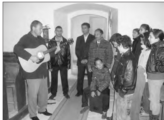
A rimapálfalvai szabadkeresztén csoport

A munkálatok hét éve kezdődtek, de anyagi hiányában elég lassan haladnak, annak ellenére, hogy a kivitelezést egy holland alapítvány is támogatja. A