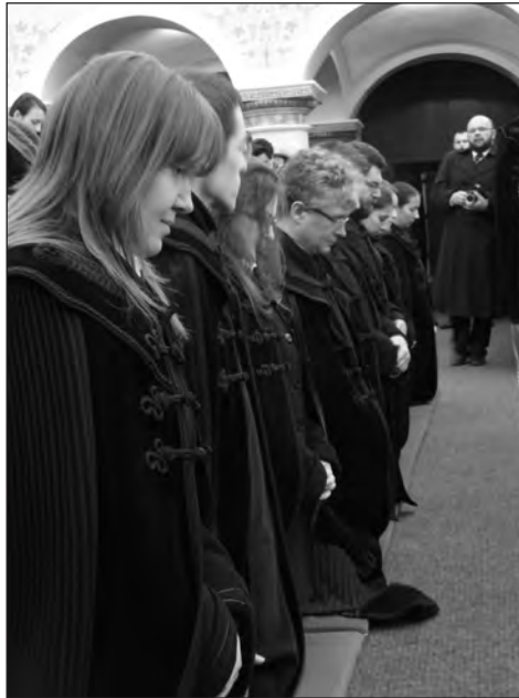
Felszentelésre várva.

javaslat kidolgozásával a problémák orvoslására, illetve az egyházmegyei tanácsokat, hogy állapítsák meg: kik felelősek a járulékok be nem fizetéséért; emelt a Zsinat a 2013. év szintjén három évre befagyasztotta a járulékok nagyságát.