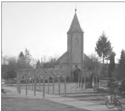
Mokcsakerész felújított temploma