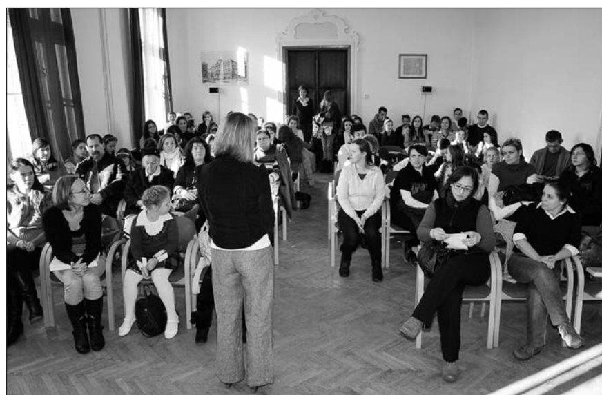
A résztvevők a rimaszombati gimnázium dísztermében.