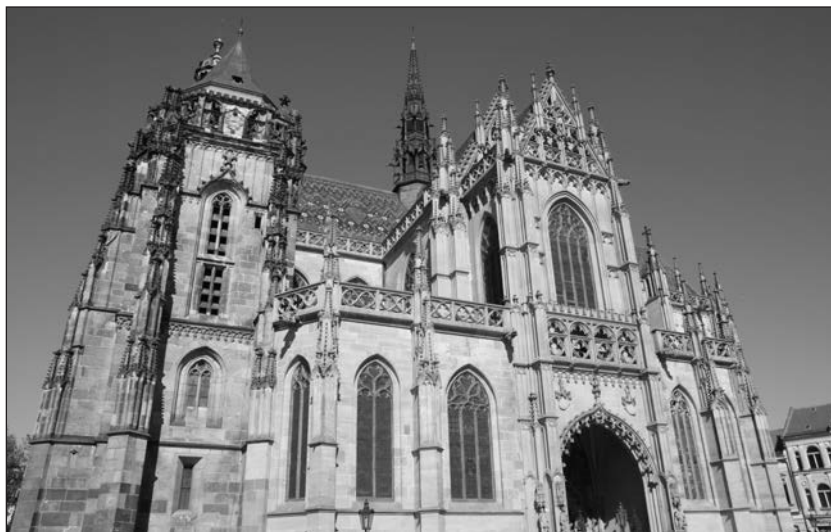
A Szent-Erzsébet székesegyház. (Kis Lázár Bence illusztrációs felvételei)

Régi vágyam vált valóra, amikor az elmúlt esztendőben eljutottam Kárpátaljára is.