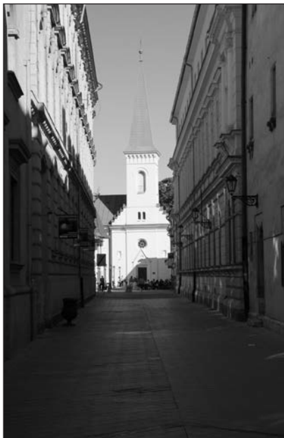
A kassai református templom

ható II. Rákóczi Ferenc kriptája, ahol úgy elnézelődtünk, hogy bezártak minket (mint egykor Jókait a Szádelői-völgy egyik Árpád-kori templomába), és várnunk kellett, míg csak nem jöttek az újabb érdeklődők.