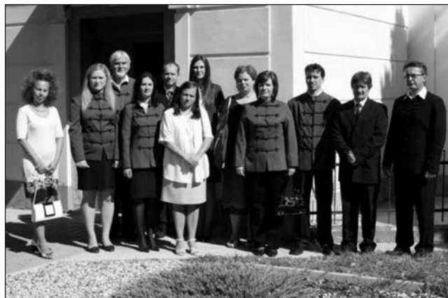
A gimnázium tanári kara a jelenlegi tanévben

Ezzel szemben van mód arra, hogy itthon, az anyagilag és szellemiekben egyre fejlődő, elkötelezett fenntartóval bíró lévai református gimnáziumban tanulhassanak (akár távolabbi vidékről