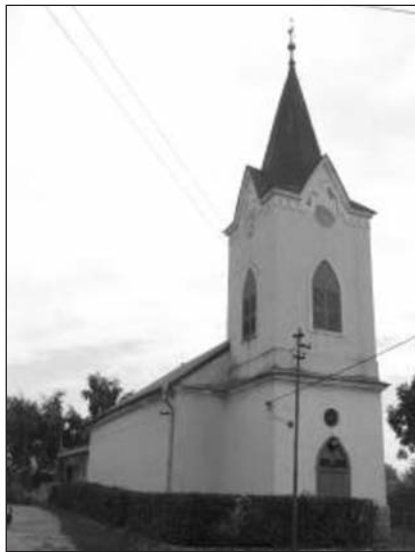
A balogiványi református templom

A családlátogatások feladatát is fontosnak tartja, hiszen az idős emberek igénylik, hogy elbeszélgessen velük. Örülnek, amikor bekopog egy-egy ház ajtaján. Nyilván ezzel azt is erősíti az emberek lelkében, hogy idős koruk ellenére, ha a templomba jutás már gondot is jelent a számukra, azért ők még a gyülekezet számon tartott tagjai. Ilyenkor az is kiderül, ha valamire