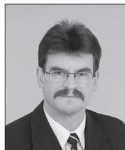
Fazekas László püspök

Egyházunk Egyetemes Választási Bizottsága a 2014. szeptember 29-én megtartott ülésén elvégezte az általános tisztújítás keretében leadott szavazatok összeszámlálását.