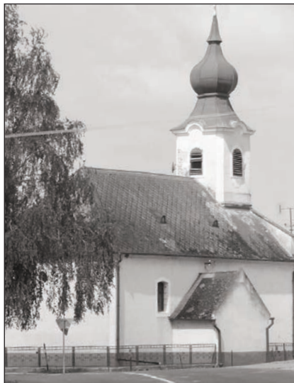
A csilizpatasi református templom