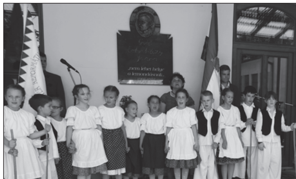
Gróf Esterházy János emléktáblája előtt zajlott a műsor az érzést; barsiak, lévaiak, iskolások, vendégek egyaránt.

Összetartozunk? Igen, ezen a napon, ezen a megemlékezésen átélhettük ezt