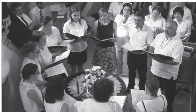
Az érsekkétyiek dicsőítik Istent

Istennek legyen hála, hogy a nagy hőség ellenére szépen és baj nélkül ment végbe a rendezvény! Köszönet a gyülekezet minden tagjának, akik a saját templomukból