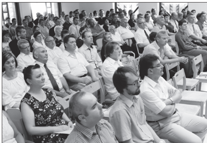
A lelkész-továbbképző tanfolyam résztvevői

Ez mutatkozik meg akkor, amikor az Isten kijelentett akaratával ellentétes döntéseket hoznak akár humánumból, vagy akár félelemből a sötétben tapogatózó tömeg közfelfogásához igazodva. Ha az egyház nem meri rámondag-