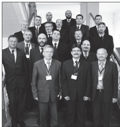
Egyházunk küldöttsége a Generális Konventen

hatalmi politika így tud „leszívárogni” a kisemberek szintjére. Amíg az amerikai kongresszusban voltak pártfogói az ügynek, addig a román bíróság független döntést hozott. Amikor Románia fontos lett az Egyesült Államoknak, akkor Buka-