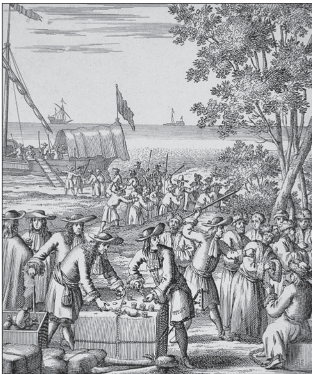
Az elítelt protestáns lelkészeket eladják gályarabnak

A király erre az 1714. április 28-án kelt rendeletében utasította a protestánsokat, hogy az 1681. és az 1687. évi vallásügyi törvényeket, s az ezeket értelmező uralkodói meghagyásokat szigorúan tartsák meg, a fölös számú lelkészeiket, tanítóikat bocsássák el, a katolikus ünnepeket kötelezően tartsák meg, a törvényben be nem cikkelyezett helyeken fizetniük kell a katolikus papoknak a stólat, s az egyéb járulékokat. 1712-től kezdődően ezzel párhuzamosan 140 protestáns templomot vesznek el, Komáromban bezárják a régi református iskolát, megtiltva, hogy ott más tanítsanak, mint az olvasás elemeit. Kizárják a céhekből Léván a protestáns iparosokat. Pápa földesura a piactéren kihirdetteti, hogy a kálvini, s a lutheri