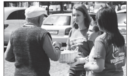
Szarvas László fotói

Akikről hírt kaptunk: Csicsón használt ruhát gyűjtöttek és válogattak, a református temetőben takarítottak és egy játszótérnek a kerítését festették le. Rozsnyón is sírokat tettek rendbe és szemetet szedtek a református iskola diákjai. Nagyöveden minden esztendőben ökumenikus alkalomnak számít a Szeretethíd, mert a római katolikus közösség tagjai is bekapcsolódnak. Felsorolni is sok, mi mindent csináltak öt napon át: öregeket látogattak, iskolát és óvodát takarítottak, gyomláltak, az idősek nappali foglalkoztatójában a gyerekek fonalat gombolyítottak szőnyeg szövéséhez és másokkal is szolgáltak, fafaragásokat helyeztek ki a faluban és temetőt takarítottak. Komáromban is színes volt a program: óvodás gyerekek boltokban énekeltek eladóknak és vásárlóknak, iskolások takarítottak, gyülekezeti tagok időseket, a kórház gyermekosztályán látogattak, szemetet szedtek. Hontfüzesgyarmaton világháborús emlékművet takarítottak, terepet ren-