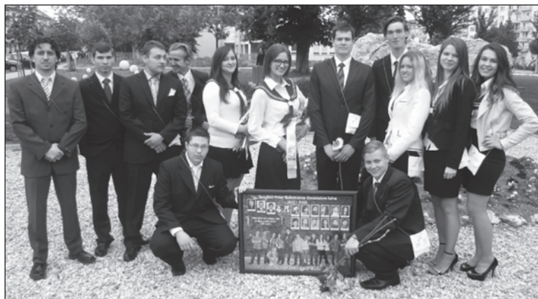
A Lévai Czeplédi Péter Református Gimnázium ballagói

Összegezve tehát: a felekezeti oktatás, benne a református gimnázium szüksé-