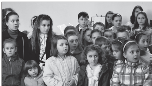
Az egyházmegyei gyermek-kórus énekesei közül néhányan.