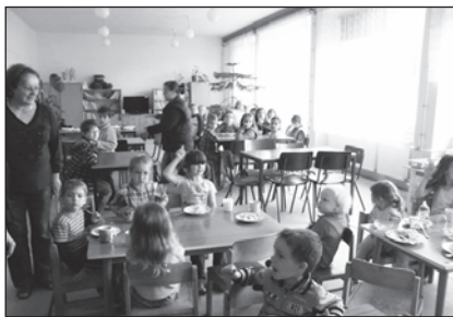
Óvodások, akik a biztonság és nyugalom légkörében éltek eddig.