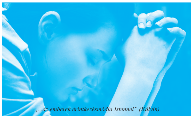
„...az emberek érintkezésmódja Istennel” (Kálvin).