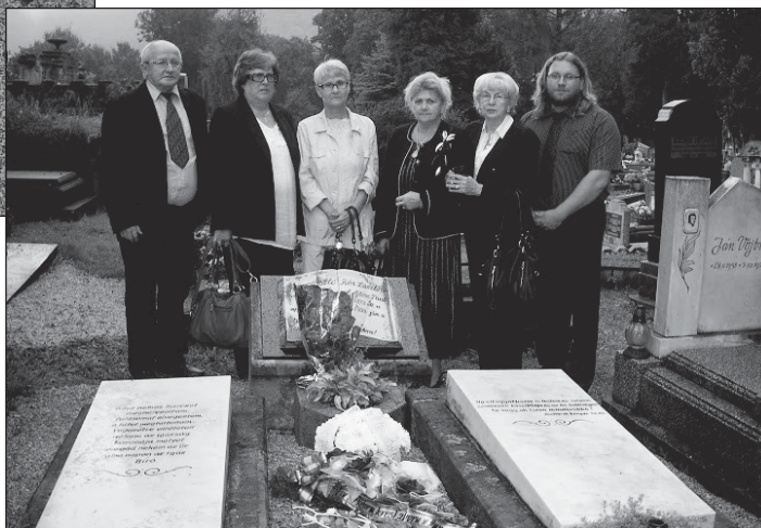
Hostia z Humenného pri hrobe

Naša dnešná spomienka môže byť len vďačným pripomenutím, ale môže byť aj upozornením pre všetkých verných, žijúcich v každom čase: „ Pozorne sa