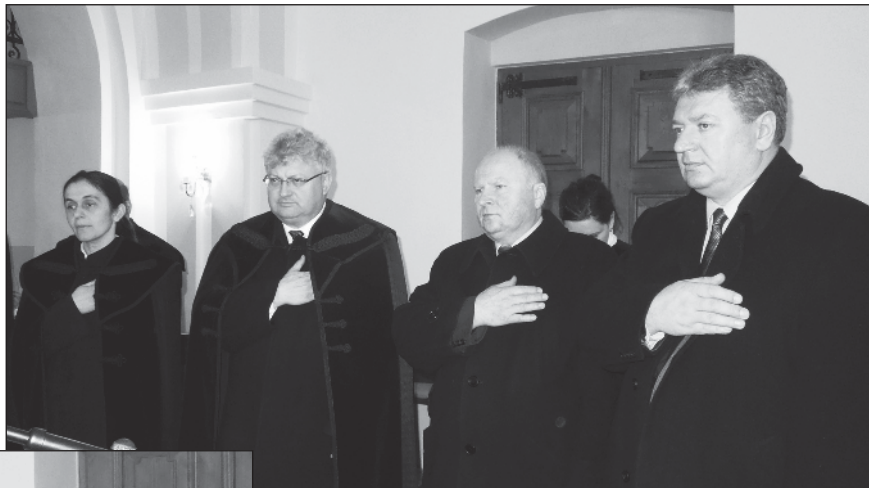
Inštalácia zvolených funkcionárov seniorátu.

základe z viacerých vybraných veršov Žid 11 vyzdvihol oddanosť predkov a hlavne vieru mužov a žien, ktorí poslúchali a nasledovali Pána. Bol to Ábel, Henoch, Noach či Abrahám, ktorý s vierou poslúchol Boha, keď ho povolal, aby sa vystaľoval do cudzej zeme.