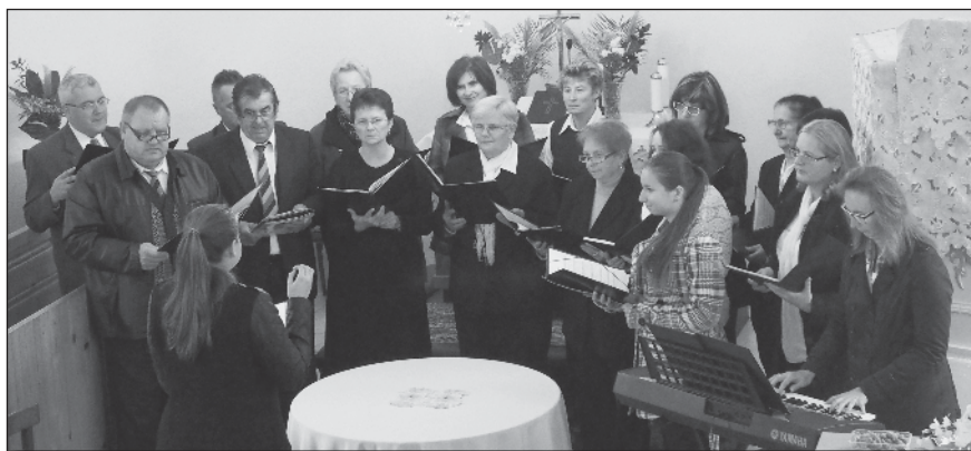
Bánovsko-ondavský a tušický spevokol v Nižnej Kamenici.